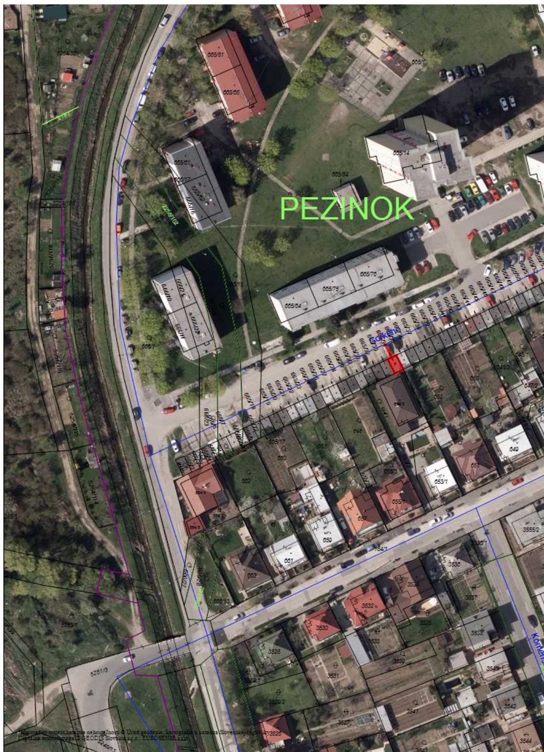
Obr. č. 2: Ortomapa.