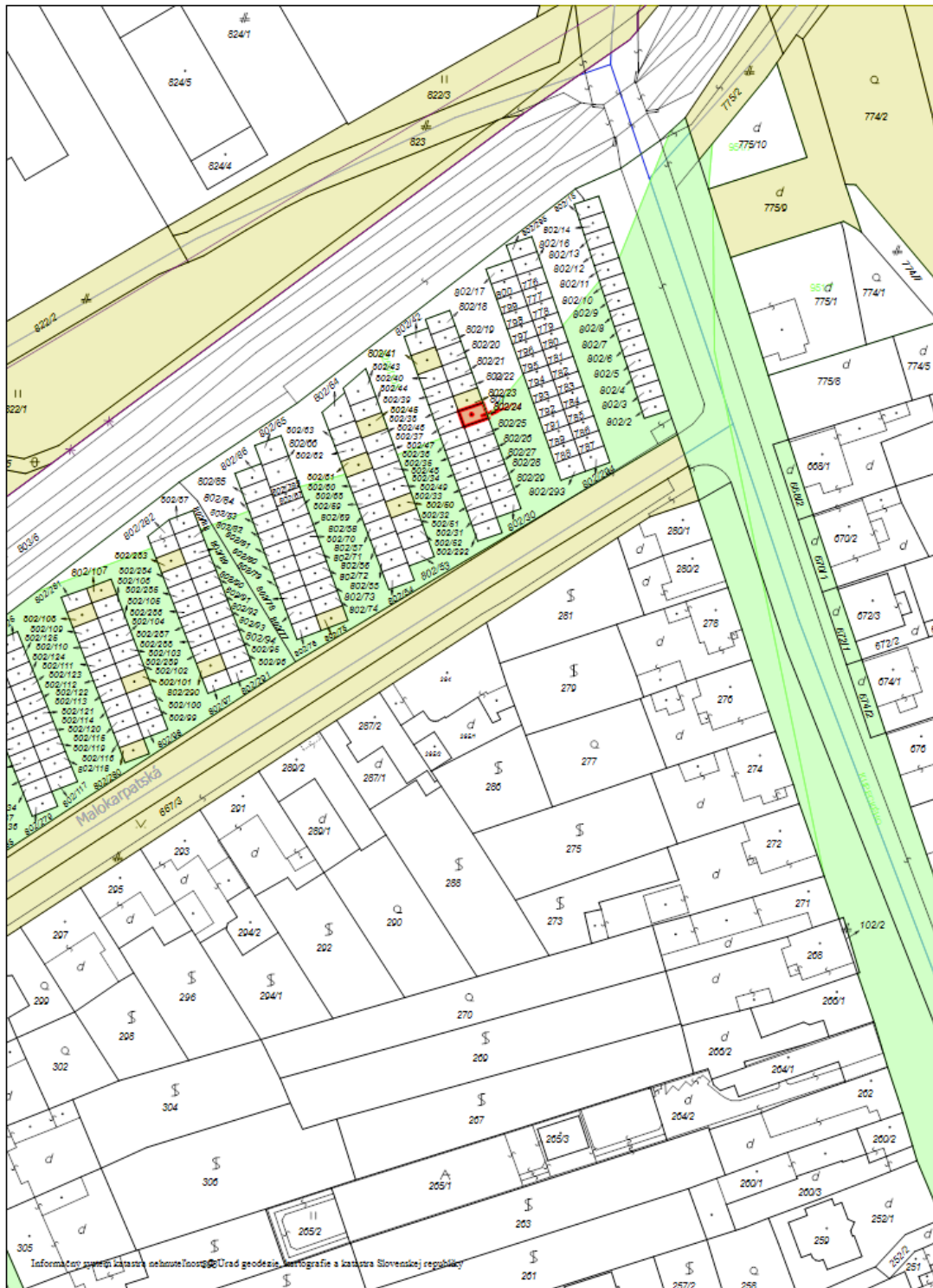
Obr. č. 1: Výrez z katastrálnej mapy.