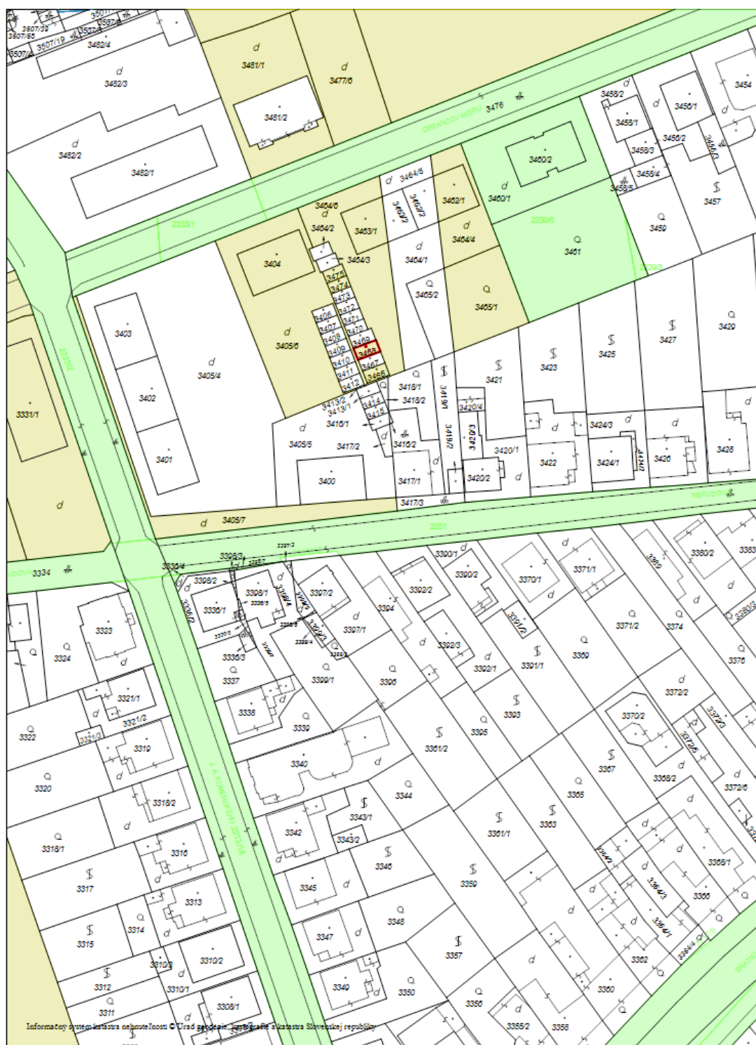
Obr. č. 1: Výřez z katastrální mapy.