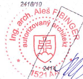
POPIS STAVEBNÝCH OBJEKTOV VIŠ KOORDINAČNÚ SITUÁCIU VÝKRES č. 1/