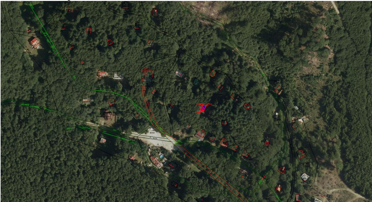
Obr. č. 2: Ortomapa