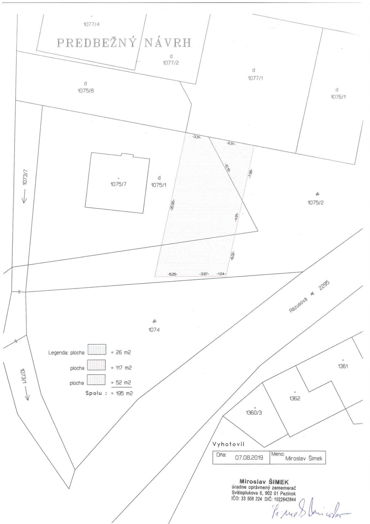
Obr. 1 – Vyznačenie predmetu nájmu (predbežný návrh GP)