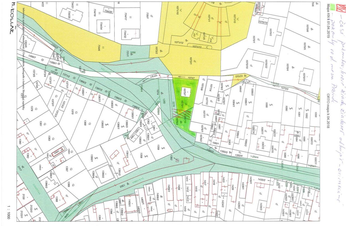
Obr. 1 – Vyznačenie predmetu nájmu (Výrez z katastrálnej mapy)